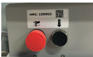
Nødstop og nødfir (separat vare- og HMI-nummer for stol med disse)