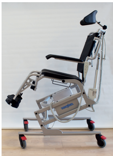
Triton/Dual med elektrisk højdejustering og sæde tilt (baglæns -30 / forlæns +7 grader)