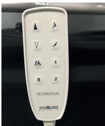
Ny håndbetjening med flere funktioner, fx transportknap og to programmeringsknapper